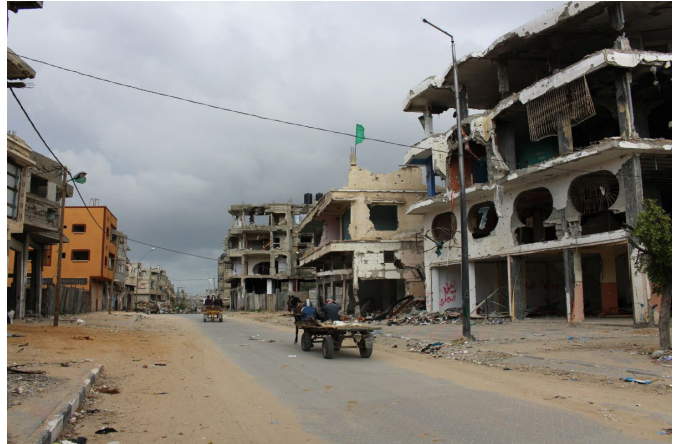
Bâtiments à Shejaiya, Gaza, une zone largement détruite durant l'opération Bordure protectrice de l'été 2014.

explosifs terrestres et aéroportés qui ont fait le plus de victimes, suivis par les tirs à balles réelles, l'effondrement d'infrastructures et de débris 4 . Outre le fait qu'elles tuent et blessent des civils, les armes explosives utilisées dans les zones peuplées entraînent une contamination par les engins explosifs 5 . On ne connaît pas l'étendue exacte de cette contamination, mais environ 7 000 000 engins abandonnés ou non explosés auraient été laissés à Gaza au cours de la seule année 2014 en raison des retombées 6 d'engins sur le territoire et des frappes aériennes israéliennes. Depuis 2014, 8 786 restes explosifs de guerre (REG) 7 ont été neutralisés et détruits sous la supervision du Service de la lutte antimines de l'ONU (UNMAS) 8 .